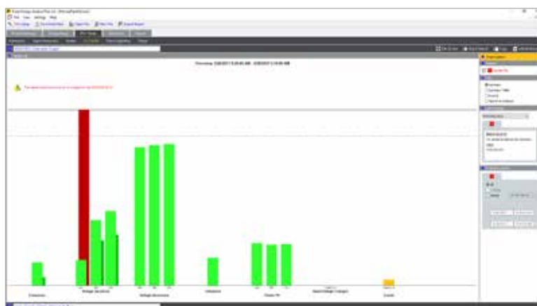
Fluke Energy Analyze Plus: Resumo do estado de saúde da qualidade da potência