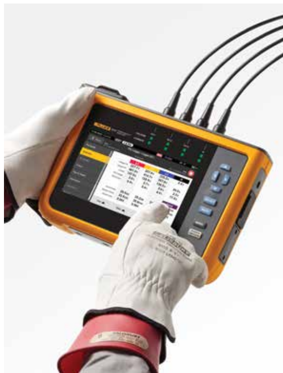
Navegue facilmente através do ecrã tátil a cores de grandes dimensões

Ao transferir dados dos analisadores de qualidade de potência da série Fluke 1770, o pacote de software Energy Analyze Plus incluído pode comparar os dados estatísticos medidos de tensão e de harmónicos de corrente com as exigências de diferentes normas como, por exemplo, a EN 50160 ou a IEEE 519, para determinar se excedem os limites de conformidade. Esta potente funcionalidade de manutenção preditiva permite que os harmónicos de corrente sejam observados antes de surgir distorção na tensão, o que permite evitar falhas inesperadas ou situações de não conformidade e aumentar o tempo de atividade do sistema. Com a proliferação de cargas e geração de energia baseadas em inversores, manter os harmónicos de corrente sob controlo está a tornar-se cada vez mais vital para garantir uma qualidade fiável da potência e evitar tempo de inatividade do sistema.