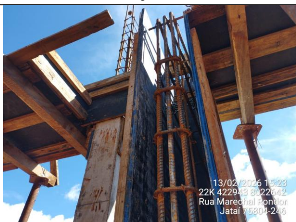
Execução de elemento construtivo