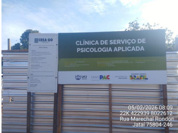
Adequação placa de obra