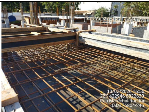
Armadura laje entrada