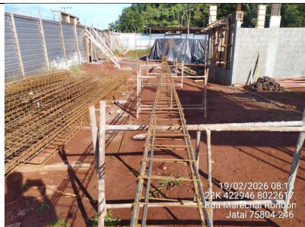
Armação vigas de cobertura