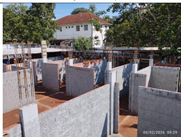
Execução de chapisco