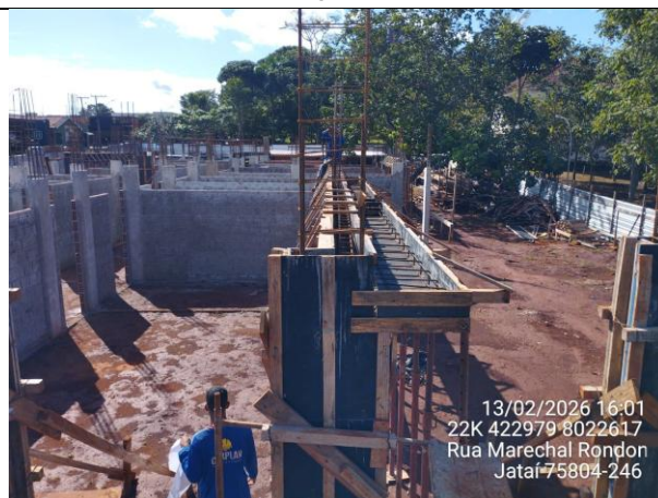
Execução das marquises