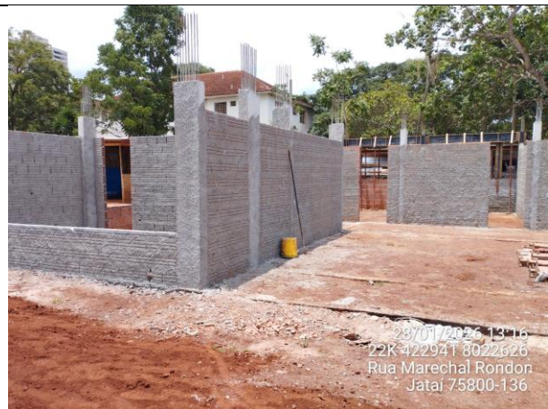
Hall de acesso