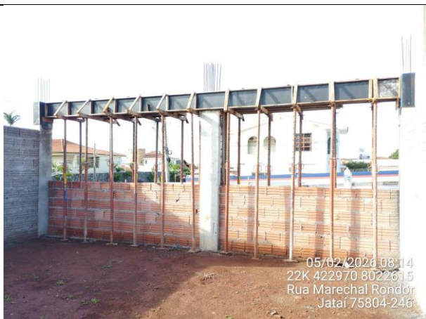
Detalhe forma viga intermediária