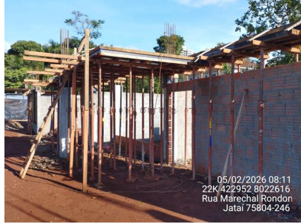
Escoramento laje acesso