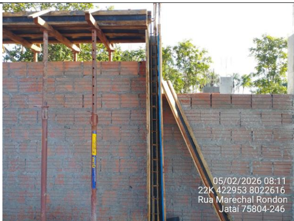
Detalhe viga invertida