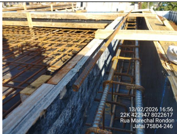
Armadura viga intermediária