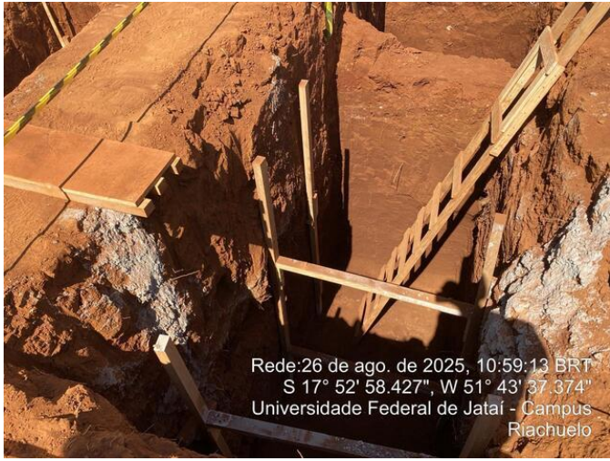
Vala da sapata com escora