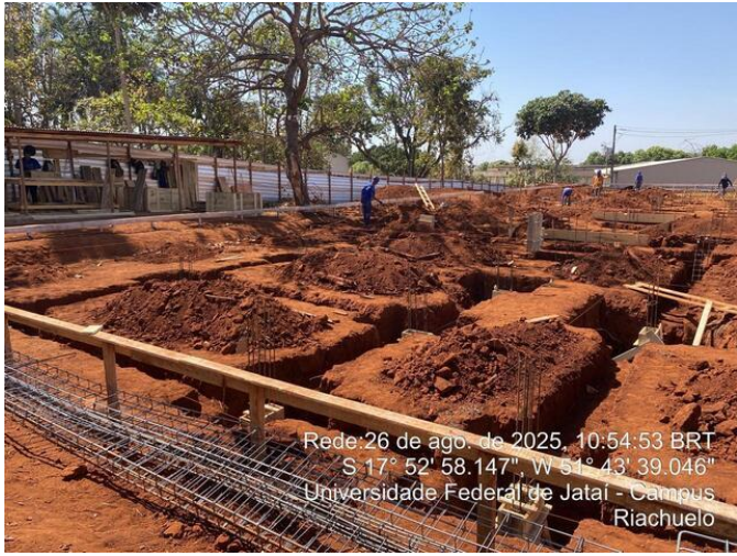
Vista geral da obra