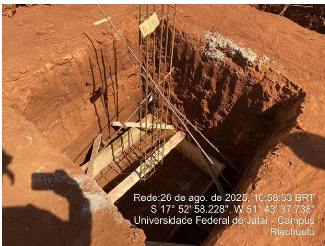
Sapata sem concreto