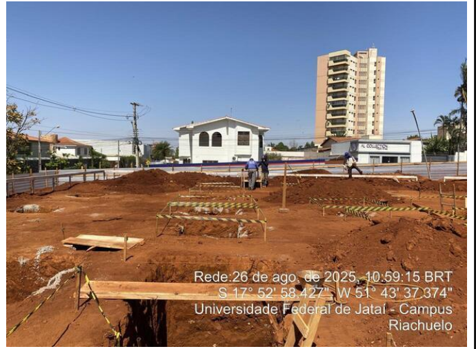
Vista geral da obra