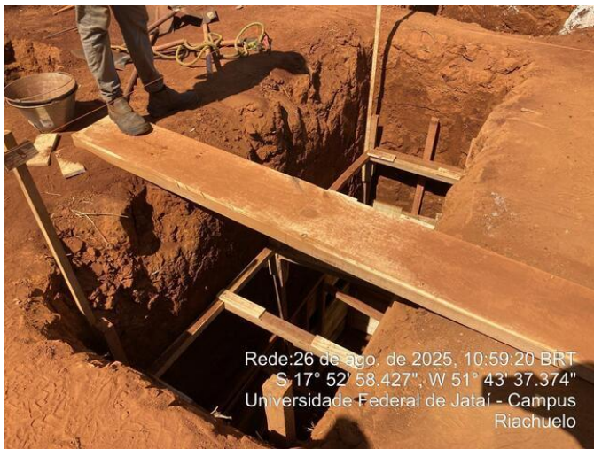
Vala da sapata com escora