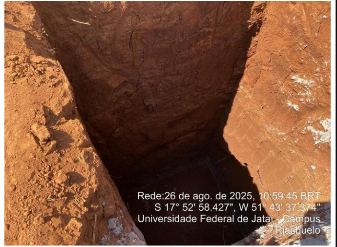
Vala da sapata