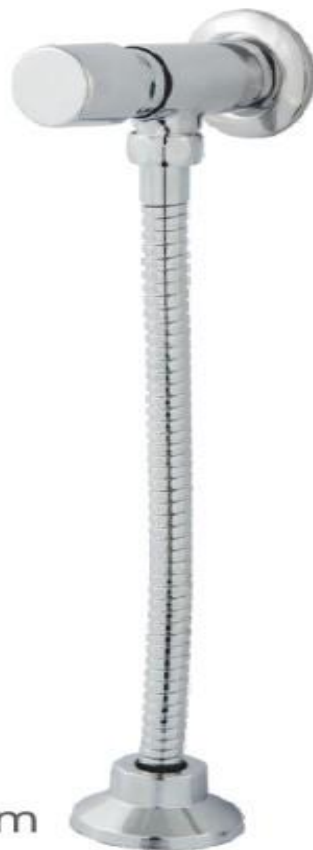
1050 Válvula para Mictório Automática c/ Engate 30cm

ITEM 249: VÁLVULA, DESCARGA, MATERIAL LATÃO, TRATAMENTO SUPERFICIAL CROMADO, BITOLA 1/2", USO DESCARGA DE MICTÓRIO AUTOMÁTICA - MODELO Gmc Metais 1050 30cm